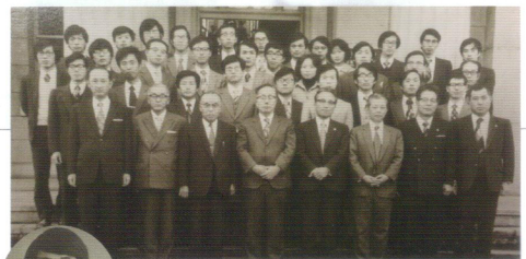
1973年9月、司法試験に合格。司法修習は京都を選択した。司法修習修了後、明舟法律事務所で半年勤務し、河合・竹内法律事務所（現くら共同法律事務所）に入所